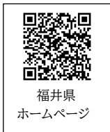
福井県 ホームページ