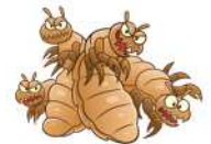
アタマジラミの卵