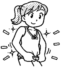
きれいな下着をきる