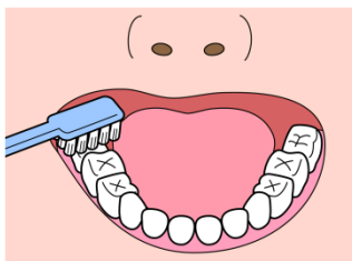
おく歯のみがき方