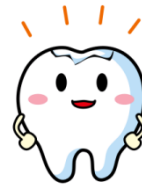
秋の歯科検診結果