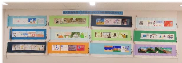
交流授業作品「オリジナル絵巻物」

また、11月11日（火）18日（火）25日（火）の3回にわたって、日本大学芸術学部の美術学科およびデザイン学科の学生の皆さんのご協力をいただき実施しました交流授業で制作した作品が完成し、北棟1階に展示しています。ぜひご覧ください。