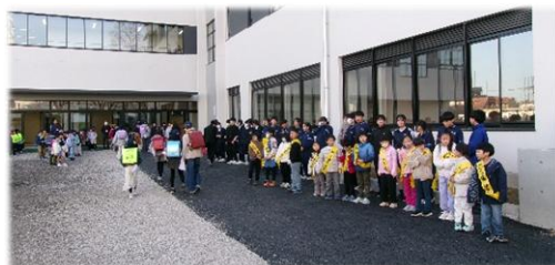
「旭丘小との合同あいさつ運動」

暦の上で寒さが最も厳しくなるとされる「大寒」に合わせるかのように、数年に一度のレベルという「最長寒波」に日本列島が覆われました。日本海側を中心に大雪となり、我が故郷の青森県の酸ヶ湯では1月として観測史上1位となる45.9cm（26日時点）の記録的な大雪を観測しました。その驚異的な雪の量は、2階建て住宅や信号機・道路標識が雪で完全に隠れる高さだそうです。雪国の皆様の安全をお祈り申し上げます。予報では、一連の寒さは3日（火）の「節分」で一段落し、4日（水）の「立春」からは春の訪れを感じられるところもあるそうです。しかし、その暖かさも束の間で、厳しい寒さが戻る見込みとの予報もあり、学校ではこれからの定期考査や私立高校・都立高校の一般入試、D組のスキー移動教室に向けて、引き続き感染症予防や体調管理に十分注意してまいります。