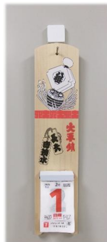
「校長室の日めくりカレンダー」

生徒の皆さん、2月のスタートである1日の格言を紹介します。2月1日のページに書かれた格言は「学問に近道なし」でした。