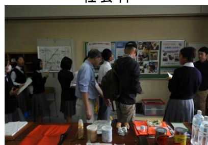
避難拠点・青少年第一地区委員会