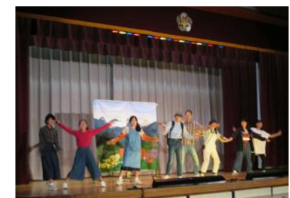
2年英語劇「The Carpenter's Gift」

○2年生は英語劇「The Carpenter's Gift」夏休みから、限られた中での練習だったでしょう。声もしっかりでて、全員がよくまとまっていて、練習の成果がでていました。10月20日の区連合英語発表会でも大変好評でした。