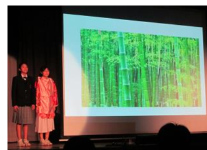
1年「竹取物語」の朗読劇

○3年生は、「おくのほそ道」への旅。松尾芭蕉の旅、240km、150日を地図提示し、その旅をたどりながら、句に込められた思いを発表していました。大変よく調べ、分かりやすく創意工夫した発表ができました。