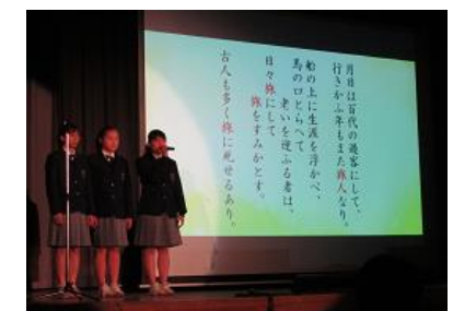
3年「おくのほそ道」への旅