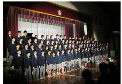
3年合唱「Recitation and Song」

○3年生は「Recitation and Song」。歌に入る前の導入の構成が大変創意工夫されていてよかったです。全員で、空へ真っ直ぐにのびるハナミズキのように、3年生全員が真っ直ぐに進んでいきたいという思いで歌い上げました。