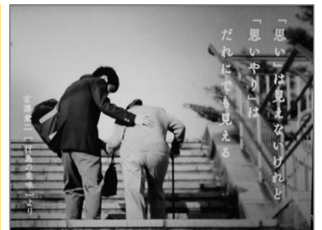
*出典：2010年度 AC ジャパン 「見える気持ちに」 制作 電通中部支社