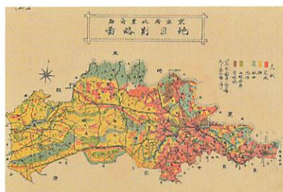
東京府北豊島郡 地目別略図 大正8(1919)年 練馬区域は北豊島郡の西側に位置し、大正期には宅地化があまり進んでおらず、畑や山林原野が広がっていました。

本展では、さまざまな目的でつくられた地図を通して、練馬区域の移り変わりを見ていきます。地図から地域を知る楽しさを味わっていただき、地域に対する理解を深めていただければ幸いです。