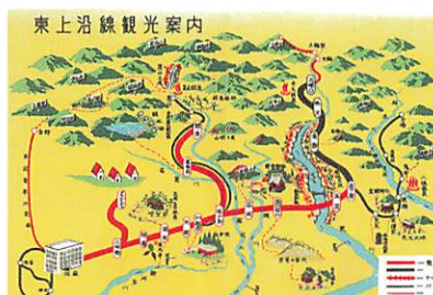
東上沿線観光案内 昭和27(1952)年 戦後、光が丘地域に造られたアメリカ空軍の家族宿舎・グラントハイツや、駐留アメリカ軍専用列車のケーシー線が描かれています。