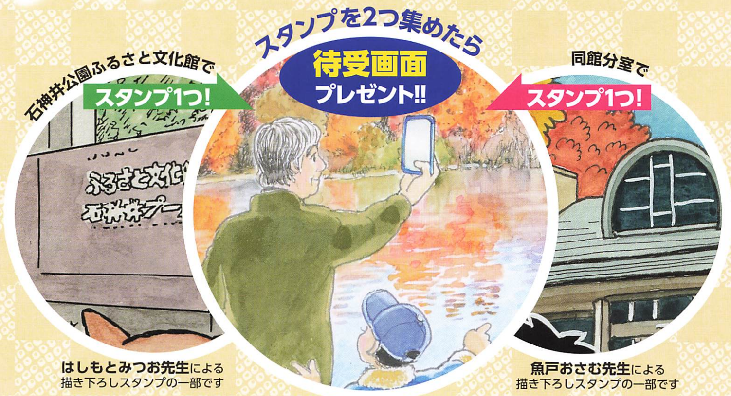
はしもとみつお先生による 描き下ろしスタンプの一部です