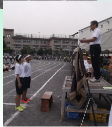
賞状・優勝杯授与！