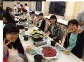
夕食はすきやきです…

1年生の時から積み重ねてきた班行動をきちんと出来るかどうか。何か不測の事態が起きたときに対応できるかどうかについては、全体的にはとても良かったと思います。3日間の修学旅行を非常に楽しんでいる様子が素晴らしかったです。能楽堂での体験学習も一生に一度の経験だったので生徒一人一人に印象深かったのではないのでしょうか。