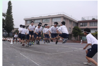
大縄跳び…よく跳ねてます