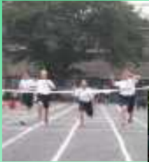
ゴールに向かって…

合わせて850名以上の方が来校して、体育祭で活躍する生徒たちを応援いただきました。ありがとうございました。