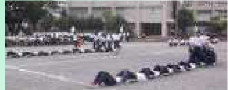
へびの皮むき…埃まみれの激戦