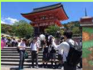
清水寺で記念写真…

5/13(金)～15日(日)3年生は修学旅行に出かけました。見事な快晴で、当初の予定通りの充実した修学旅行でした。