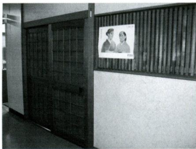
9 和室 平成5年、改修された和室。茶道の練習はそれまで現「生徒会室」にゴザを敷き行っていました。