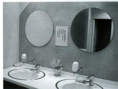
6 トイレ 平成17年改修された東トイレ。センサー付、便座も温か。生徒たちの憩いの場(?)になっています。