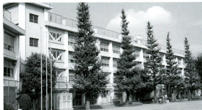
14 校庭(イチョウ) 現在は屋上をはるかに超えるイチョウの木。開校当時イチョウの木を運搬してくださった渡辺政嗣様のお話。「今は公園になっている北町2丁目の大木邸のイチョウをトラックで運び植樹しました。当時は北町中開校に向けて町会の人たちがボランティアで色々なことに関わりました。」