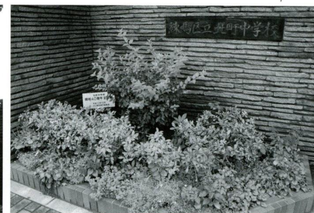
1 花壇 「40周年記念」として植樹されたものです。