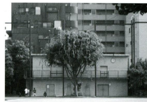
3 倉庫 昭和40年築。2階には災害時用の備品が入っています。

校内編 現在の三年生に北町中や地域の中で「気になっている場所」「憩いの場所」を聞きました。まずは、校内編。