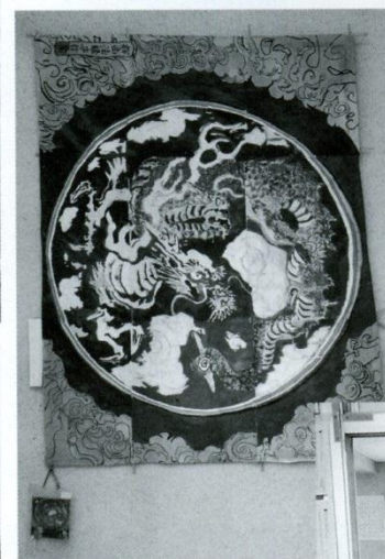
10 絵(中央階段) 「京都妙心寺法堂天井絵の模写」平成12年、当時の2年生が文化祭の展示作品として制作したもの。状態もよく北町中生の穏やかな生活ぶりを物語っています。