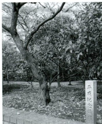
11 校庭(果樹園) 「平成」を記念し、造園されました。美味しそうな実がなります。