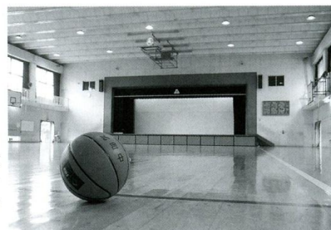
13 体育館 昭和63年(1988)3月完成の本校にとっては2代目の体育館。行事・部活の思い出がたくさん詰まっています。