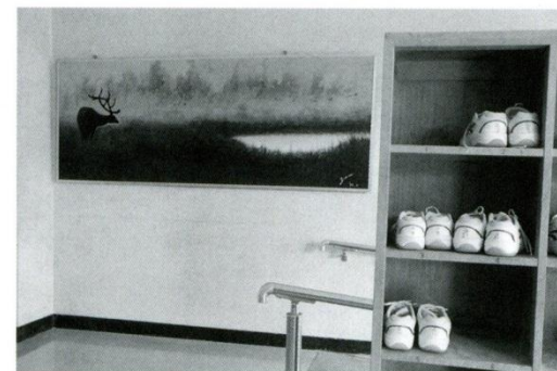
4 絵(1年昇降口) 昭和59年、当時の美術科須崎善造先生(故人)の作品です。