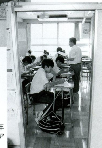
15 教室 教室内の上に注目。今年度から普通教室にもエアコンが設置されました。