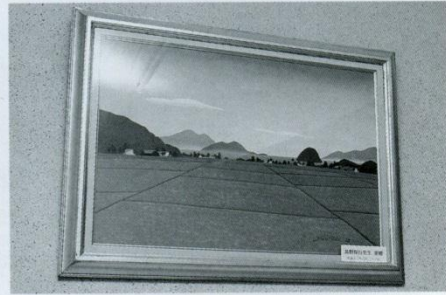
5 絵(東階段) 福井県三方五湖の風景画。作者は当時の美術科講師島野保行先生です。平成13年「教育相談室」設置に伴いそこに飾る絵を…と頼まれたのですが大きく立派な絵であり、現在の場所に掛けられました。島野先生はお父様が初代教頭、お義兄様が8代目の教頭ということで本校にゆかりの深い先生です。