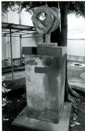
12 モニュメント 開校30周年を記念して建てられました。タイムカプセルが埋められているそうです。