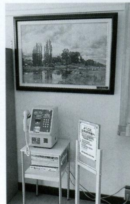
8 絵(職員来賓用玄関) 開校40周年記念として飾られました。