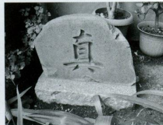
7 石碑(真) 小さな碑ですが、いわれがあります。昭和46年、会議中倒れ急死した菅沼定輝先生を悼んだもので、当時先生は国語科・バレー部顧問40歳になるかならないかの方でした。学校葬が土曜日の午後、体育館で行われたそうです。