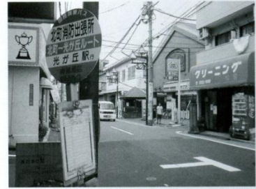
7 バス停 平成18年から循環するようになったコミュニティバスの停留所。教職員も光が丘方面の出張で利用しています。