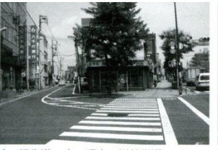
左、旧街道。右、現在の川越街道。