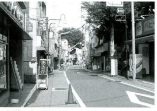
旧街道で木が見られるのはここだけ。