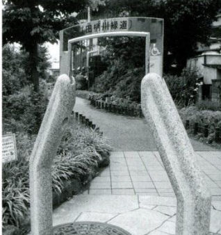
1 緑道 憩いの場所の筆頭は「田柄川緑道」…草木はもちろん噴水や遊具もあり思い出の場所でもあります。