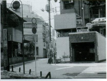
6 地下鉄赤塚 「宮団赤塚」から「地下鉄赤塚」となった駅の出口(北町8丁目付近)。今年(平成20年)6月副都心線が開通し「渋谷」まで行かれるようになりました。