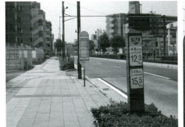
5 新大宮バイパス付近 今まさに「平和台」方面(放射第35・36号線)につながる工事が開始されようとしています。