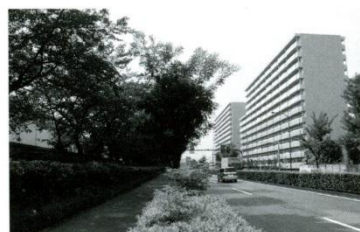
9 自衛隊官舎 4棟完成し多くの生徒たちが北町中に通っています。14階から見る景色は最高だとか。