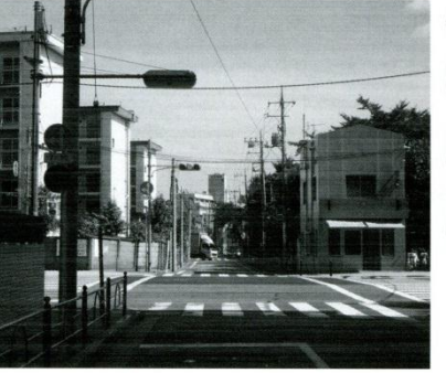
2 環八陸橋と北町交番 平成18年、長い工事の末、環状八号線が開通。同時に「富士街道」という名称も聞かれなくなりました。交番は昔と同じ場所に建っています。(交番は昭和34年(1959)4月開設。来年50周年だそうです。)