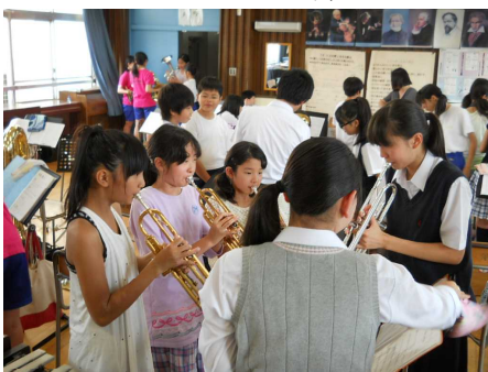
吹奏楽部個別練習