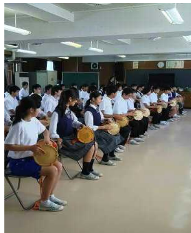
姿勢や呼吸法の指導 そう簡単には、いい音が出ません。