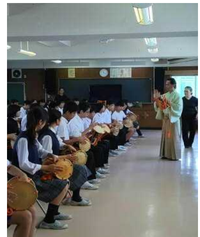
鼓に向かう態度の指導 等貴重なお話をして下さいました。