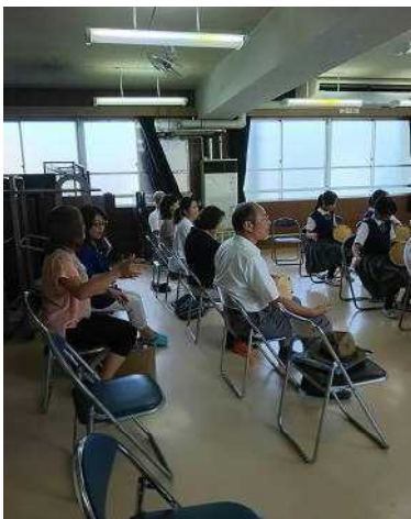
地域の皆様も授業体験