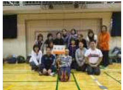
【11/28 好天に恵まれた駅伝大会：男女とも襷をつなぎ、個人走も完走しました。】