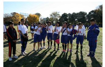
役員さんのコース整備 選手・応援集合写真 加藤先生の応援も感謝 初挑戦、見事に完走