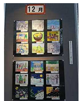
健やかカレンダー 原画展より