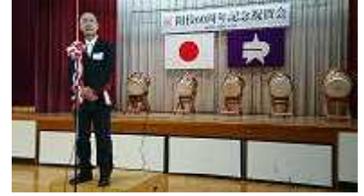
マーチングの記念演奏