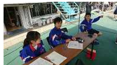
(オフィシャルで活動中)