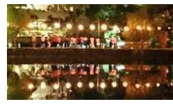
猿沢の池 ナイト ウォーク