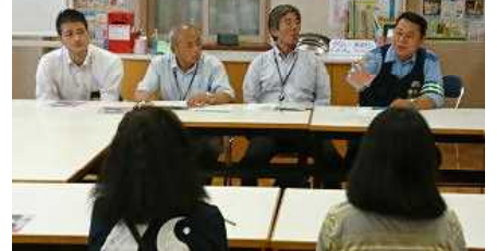
犯罪被害の防止について 光が丘警察署からご指導を 頂きました。