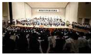
フィナーレ 全員合唱 夢の世界を 練馬区の歌