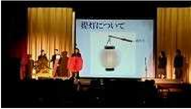
1年遠足 上野・浅草