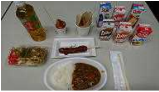
グレンキッチンメニュー