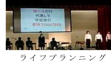
ライフプランニング