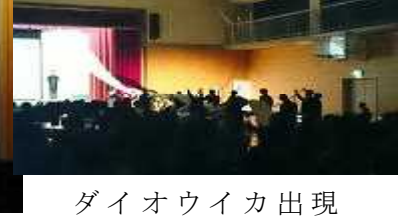
ダイオウイカ出現