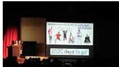
オリンピック・パラリンピック学習