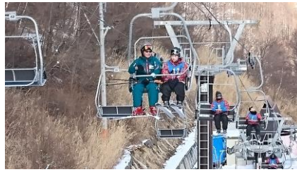
各班員は、リフトに乗車しました。