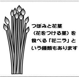
つぼみと花茎(花をつける茎)を食べる「花ニラ」という種類もあります

新しい葉が出てくる3~4月ごろが旬とされていますが、根元から刈り取ると次々に葉が生えてきて、年に数回収穫することができます。