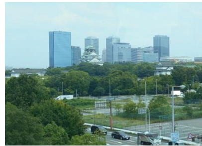
大阪城が見えました！！