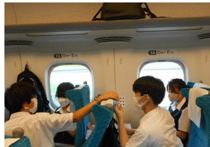
列車内では、皆仲良く過ごしていました。