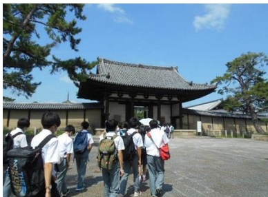
法隆寺に到着です。暑い！！