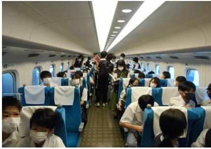
座席に座ってホッと一息。