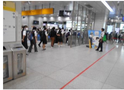
あっという間に新大阪