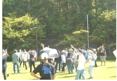
宿舎に戻って、フープリレー