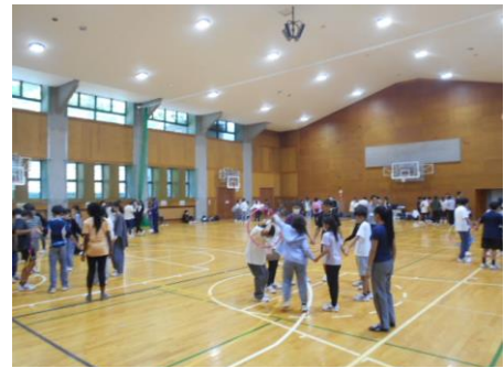
続いてはボッチャ