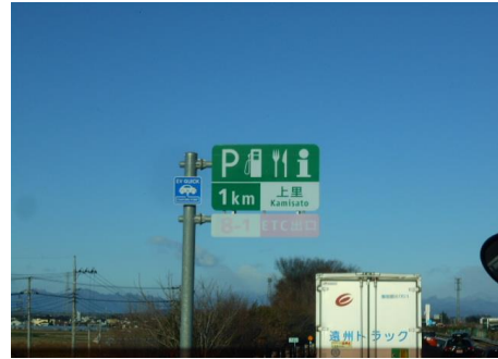
関越自動車道からは、少し雲がかかっていましたが、赤城連山も見えました。