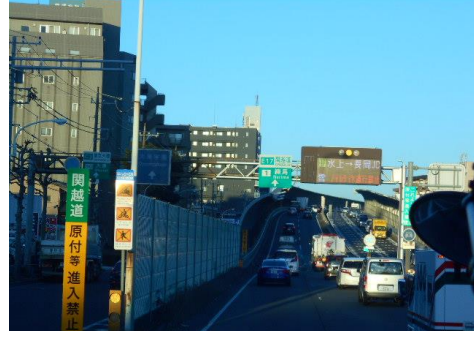
学校を出てすぐの車窓から、富士山がきれいに見えました。朝から交通量が多いです。