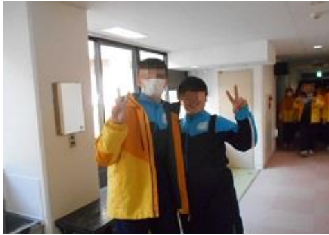
二人そろって、余裕のピース。