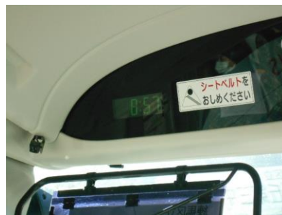
朝食を済ませ、2日目の講習に。定刻前に出発です。