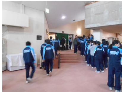
朝食の時間に向け、早めの行動です。