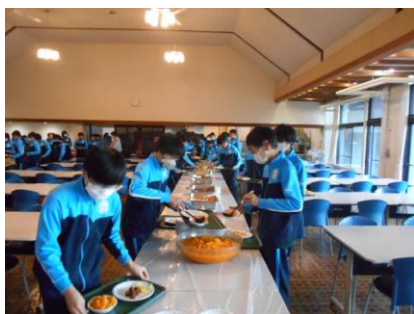
朝食はバイキング形式でした。