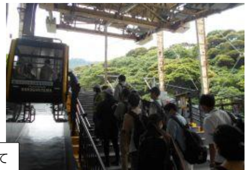
鋸山山頂に向けて