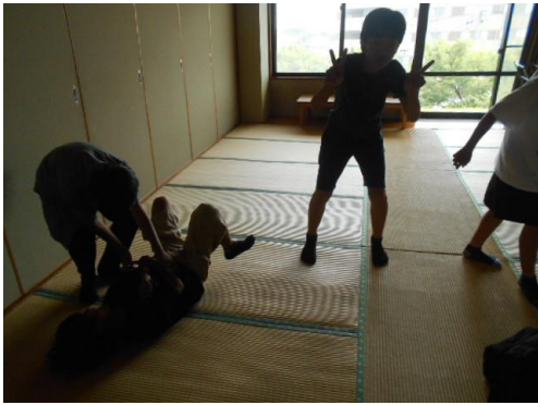
昼食の終わった男子部屋は、過ごし方も様々です・・・(逆光でスミマセン)