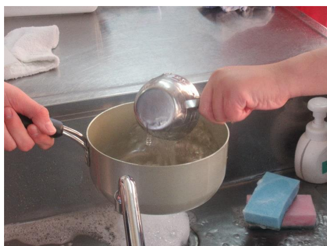
水を測って入れます。