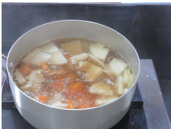
鶏肉、調味料も入れます。