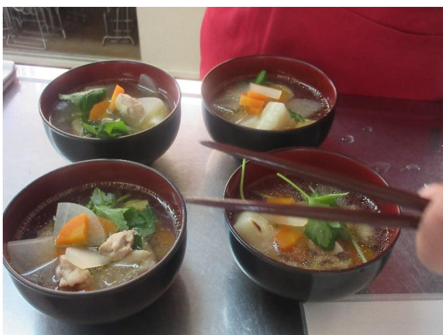
みんなの分も作りました。