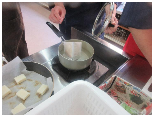
お鍋に出しを入れて火にかけます