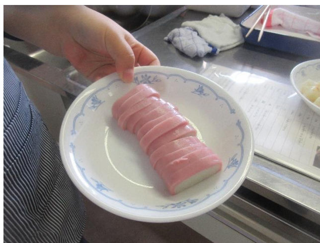
カマボコを用意して