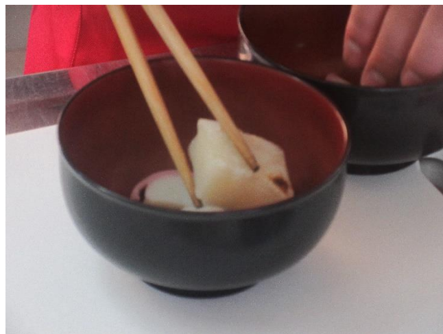
お椀に具材を入れて