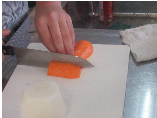
大根、ニンジンをいちょう切りにして