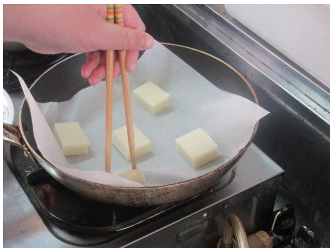
フライパンでお餅を焼いて