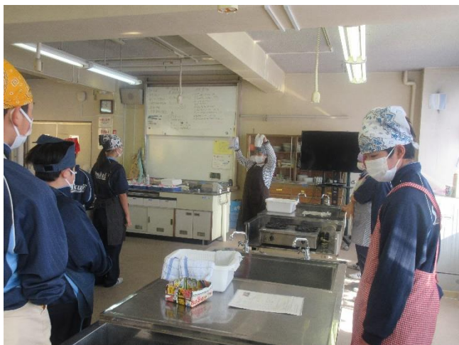
先生から手順を説明