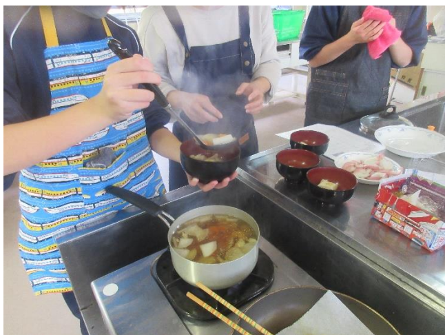
お椀にお汁も入れて