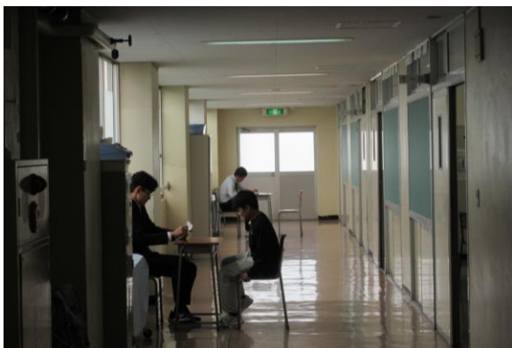
「二者面談」学期に一度、担任の先生と面談をします。