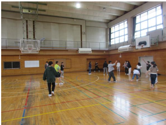
「体育館開放」はじめての体育館開放。のびのびと遊びました。