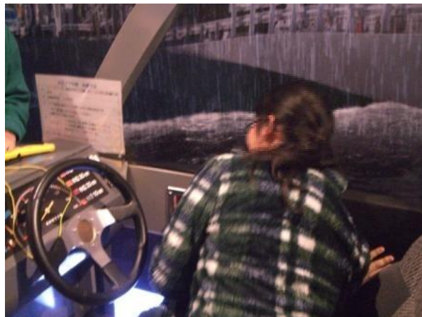
水圧体験(自動車の中で)