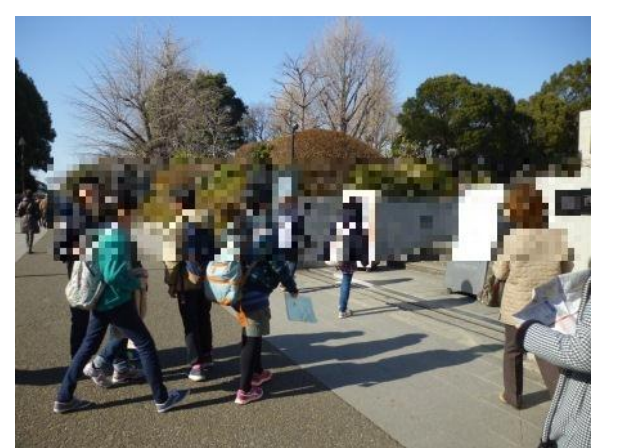
国立西洋美術館にて