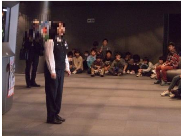
本所防災館(係の人から説明聞いて)