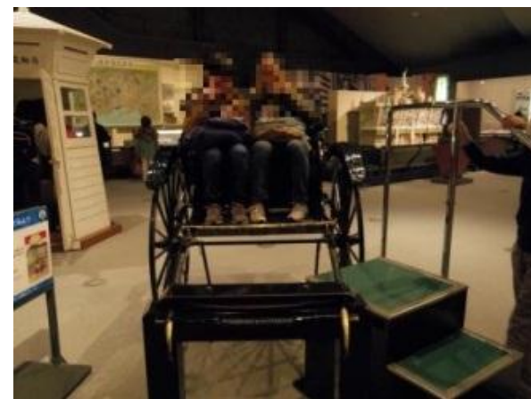
江戸東京博物館館内にて