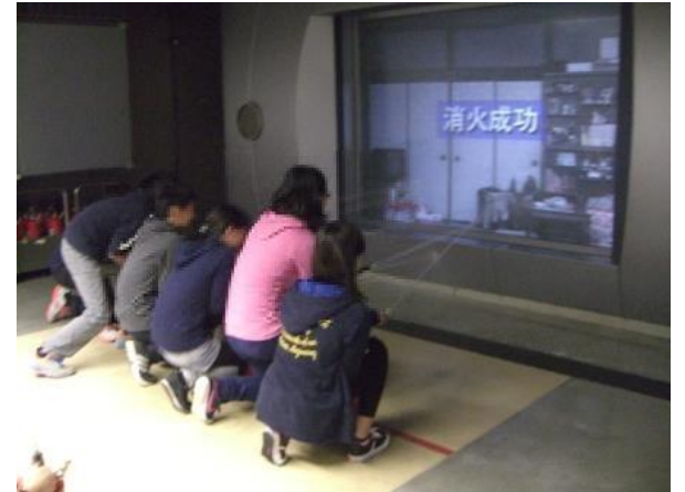
消火体験(消火器を使って)