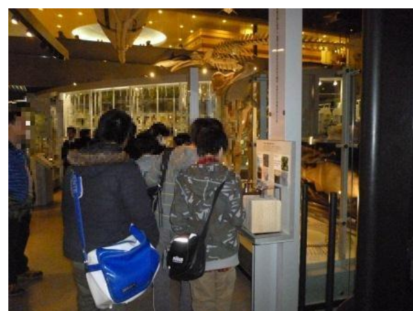
国立科学博物館館内にて