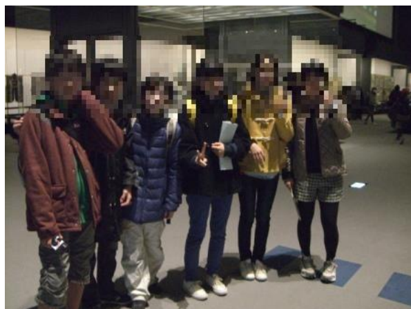
江戸東京博物館館内にて