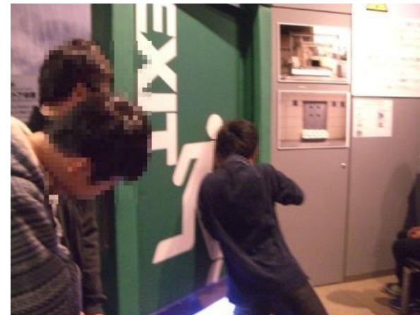
家のドアで(重たくて開かない)