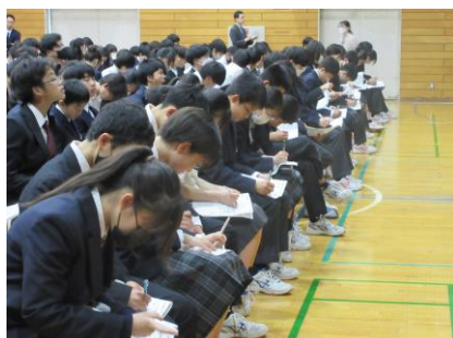
リスクを見積もります