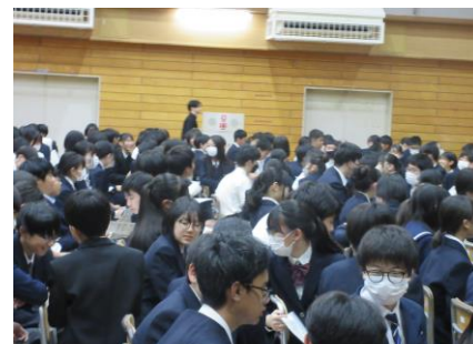
仲間との意見交流