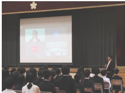
オンラインでの講話

今年度のセーフティ教室はNTTドコモ スマホ・ネット安全教室の方が講師となり、オンラインで講演をしていただきました。SNSなど便利に使える一方、そこに伴うリスクについてを再認識させられました。リスクの発見、リスクの見積もり、リスクへの対応など、その起こりやすさや起こったときの被害の大きさなどを考え、生徒同士交流しながら学ぶことができました。