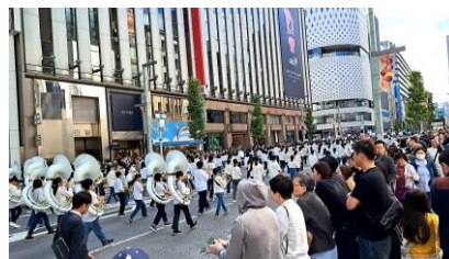
大勢の観客の中、堂々と演奏