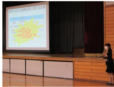
～法律的観点でのお話～