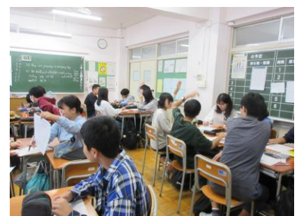
～係決め・事前学習～