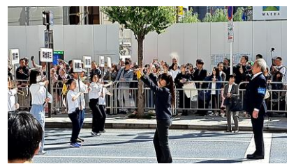
ドラムメジャーは石西2年生！