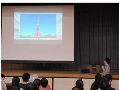
～都内巡りガイダンス～

かつて江戸と呼ばれた東京の町並みや歴史ある文化的施設など、過去と現代を比較して見て回るとは大きな学びとなるでしょう。江戸から東京がどのように発展してここまでの都市になったのか。古き良き文化や施設はどれほど残っているのか。この東京をさらに発展させていくためには何が必要なのかなど、比較して考える視点やテーマをそれぞれもって学習をしてほしいと思います。