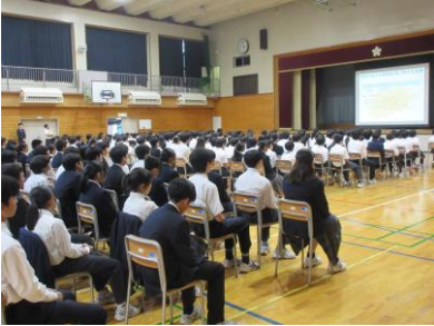
～しっかり聞けました～

10月11日(金)に薬物乱用防止教室が行われました。覚せい剤や大麻の危うさの話だけでなく、最近では市販薬の用法を守らずに服用し、命を危険にさらしてしまう「OD(オーバードーズ)」についても話もありました。何事も正しくものを扱う判断力が求められます。でも、ときにはその判断力が鈍ってしまうような状況に陥ってしまうこともあるかもしれません。そのようなときには、自分一人で判断せずに、まわりの信頼のおける大人に相談したり、相談ができる機関に連絡を入れたりしてほしいです。