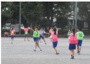
ディスクを追いかけます

10月20日(日)には練馬区の中学校の合同バンドが「秋の銀座 交通安全ゴールデンパレード 2024」に参加し、本校の吹奏楽部の部員も素晴らしいパフォーマンスを披露してくれました。当日は秋晴れの中、大勢の観客に見守られ、いきいきとした表情で演奏していた姿が印象的でした。