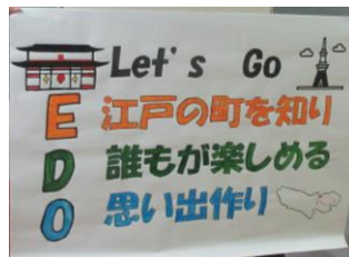
イラストも入れました!