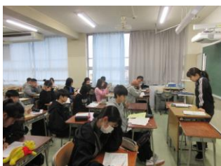
しおり読み合わせ