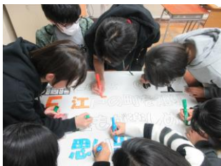
スローガンづくり