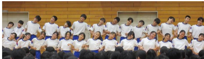
～ 2年生 優秀賞 F組「恋愛」 ～