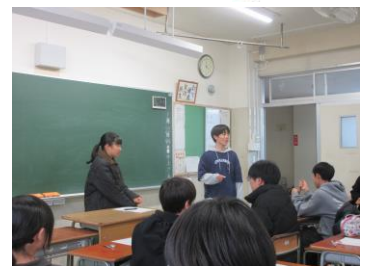
～実行委員会の様子～

21日(火)の放課後に宿泊スキー移動教室実行委員会が開かれました。実行委員は体育委員で構成されたメンバーです。この行事の目的や自分たちの役割をしっかりと把握し、責任をもってやり遂げようという積極的な姿勢が個々に見られた、よい実行委員会ができていました。