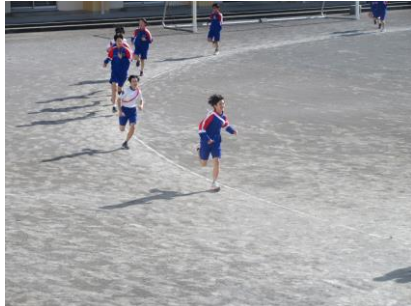
先頭いいペースです

3学期、保健体育の授業では長距離走を行っています。元気な声が校庭から聞こえてきたので、様子を見てみると、各チームでタスキをつないでいく「駅伝」を行っていました。長距離走だとペアの記録担当の生徒が声をかける様子はありませんでしたが、駅伝だとチームみんなの応援の音が走者にかけていました。応援や前向きな言葉はその人に勇気や大きな力を与えられるということを改めて感じた授業の一場面でした。