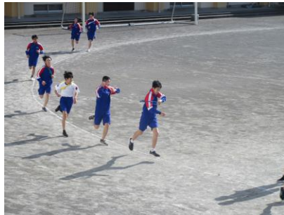
襷をはさずタイミング