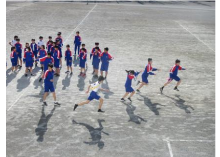
応援の音が校庭に響きます