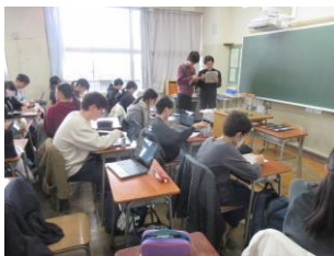
計算式を学んでいます

3年生では、「 自分の進路について、自分自身の言葉で語れる 」という姿が到達してほしい姿です。まわりのアドバイスを受けながらも、最後に進路を決めるのは自分自身です。真剣に自分に向き合った分だけ、堂々とした自分自身の言葉となってまわりの人へ表現することができると思います。思っているよりもあっという間に3学期は終わってしまいます。3年生に向けて、みんなで準備を進めていきましょう。