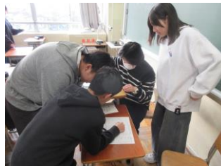
5教科で何点取ればよい？