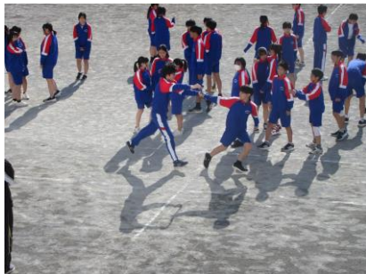
上手に襷をつなぎます