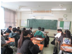
各校の合格点との比較