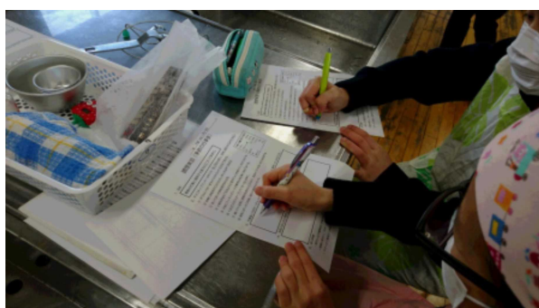
その間にレポートを作成しました。