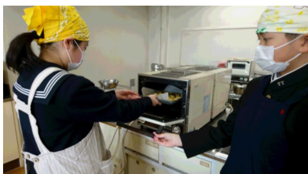
オーブンに入れて焼きます。