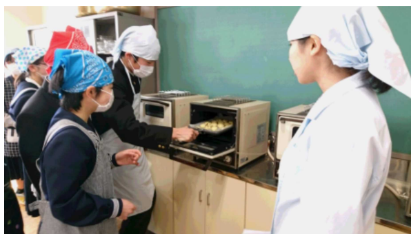
焼き上がったかな？