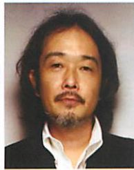
リリー・フランキー イラストレーター 作家・俳優など