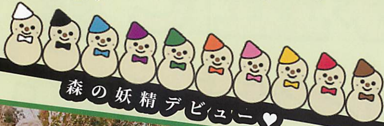
森の妖精デビュー♡