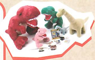
※画像はイメージです。実際の商品とは異なる場合があります。

展覧会の後は、恐竜グッズが盛り沢山の特設ショップでお買い物&会場内のカフェでひと休憩！軽食やドリンクなど本展特別メニューもお楽しみいただけます！