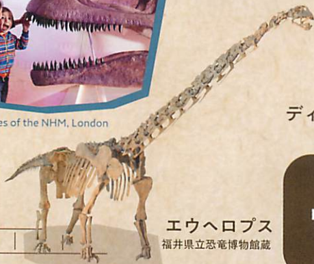
エウヘロプス 福井県立恐竜博物館蔵