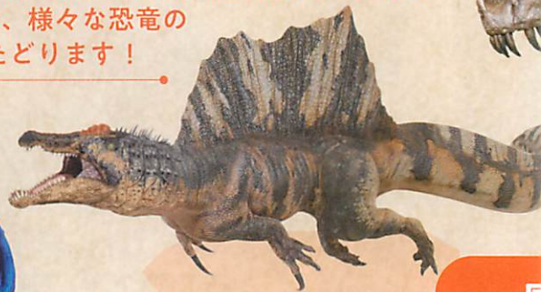
スピノサウルス ◎ココロ

全長13mに達するティラノサウルスも、祖先をたどると原始的な種では2mほどしかなかった?! この章では、様々な恐竜の進化をたどります!