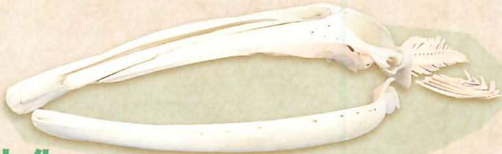
ナガスクジラ 福井県立恐竜博物館蔵