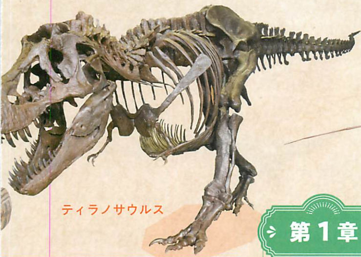
ティラノサウルス