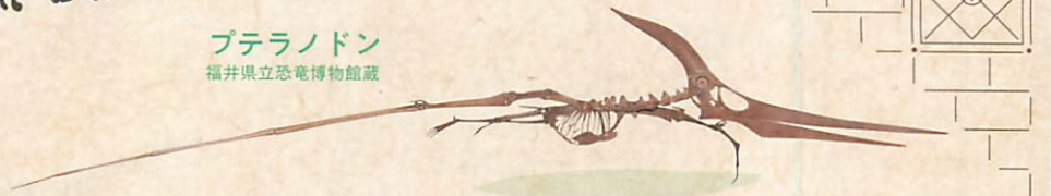
プテラノドン 福井県立恐竜博物館蔵