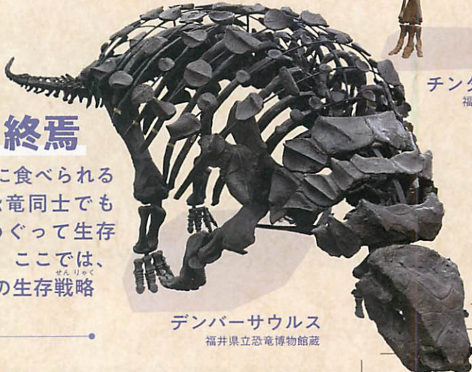
チンタオサウルス 福井県立恐竜博物館蔵

草食恐竜は肉食恐竜に食べられるだけでなく、草食恐竜同士でもエサとなる植物をめぐって生存競争にさらされます。ここでは、様々な草食恐竜たちの生存戦略を紹介します。