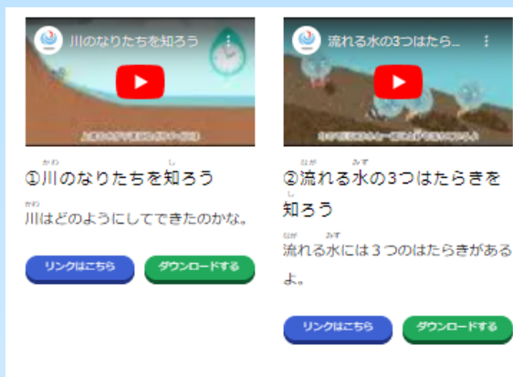
分かりやすい紹介文 「流れる水の働きと土地の変化について学ぼう」