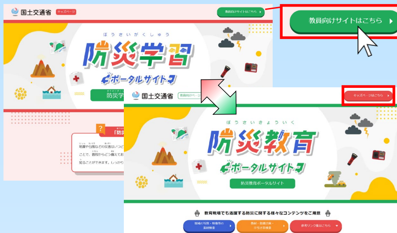
子ども向けページと教員向けページ