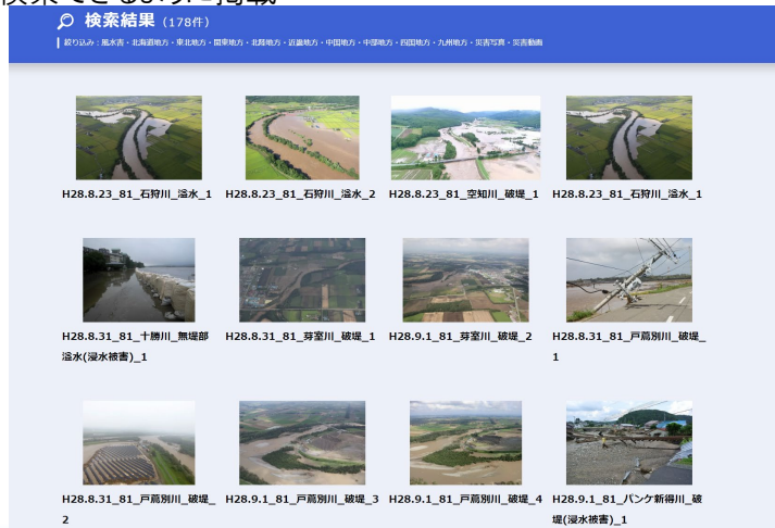
充実したデータ(写真・動画)