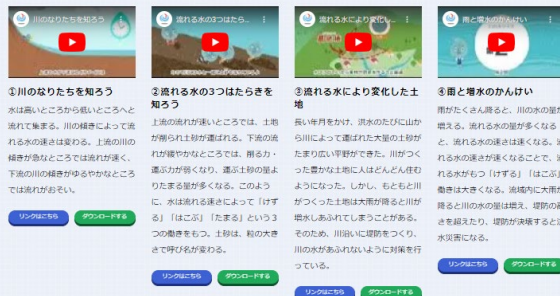
テーマごとに4分割した短時間動画