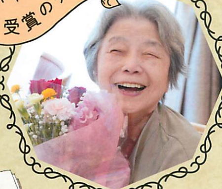
▲第16回フォト部門最優秀賞 「花束より素敵な笑顔」