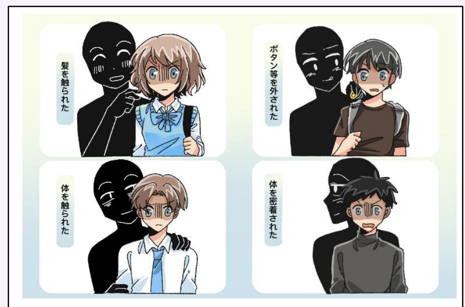
【痴漢対策に関する基礎知識等をイラストでわかりやすく解説】

※痴漢行為をさせないため、犯罪行為をしてしまう本人やその家族などを対象とした『犯罪お悩みなんでも相談』窓口の紹介も行っています。