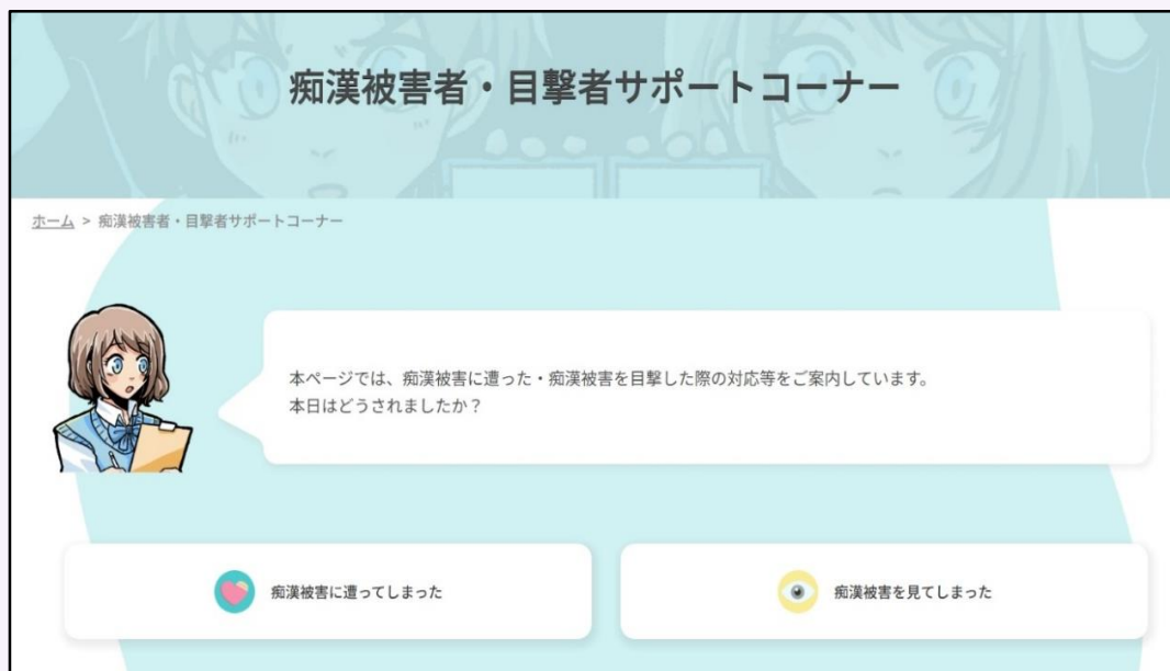
【被害に遭った方等をサポートするため相談先などを案内】