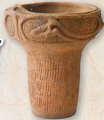
石神井出土の縄文時代中期の土器