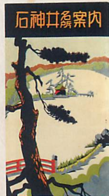
石神井名所案内 昭和8(1933)年 武蔵野郷土向上会が発行したガイドブックで、 表紙には三宝寺池が描かれています。

石神井は、練馬区内の地名で、都立石神井公園があることで知られています。三宝寺池の湧水や石神井川の流れに恵まれた地であり、人びとが水と関わりながら暮らしてきました。水の恩恵を受けて、旧石器時代から人々の生活が営まれ、中世には、石神井川流域に勢力を拡大した豊島氏によって石神井城が築かれました。近世になると、江戸近郊農村として発展するとともに、三宝寺池周辺は風光明媚な場所として、江戸の文人にも知られるようになりました。枯れることなく湧き出る水源である三宝寺池にまつられた弁天社(現巖島神社)は、石神井川下流の人々から信仰を集め、祭礼時には江戸から訪れる人々で賑わいました。また、三宝寺池には主が メシ いと信じられており、伝説も伝わっています。