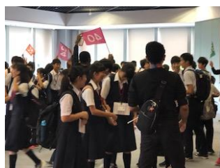
エージェントとの挨拶

「東京グローバルゲートウェイ」に到着すると、各グループにエージェントが付き、エージェントの案内で「エアポートゾーン」「ホテルゾーン」でのセッションや「身近なものから効果音を作りだそう」「橋を制作して強度を競おう」「コマ撮り作品を作ろう」「プログラミングを体験しよう」「ダンスパフォーマンスしよう」などのセッションに取り組みました。この経験を、これからの生活や英語学習に活用して行きましょう。