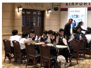
エアポートゾーン・ホテルゾーンでのセッションの様子