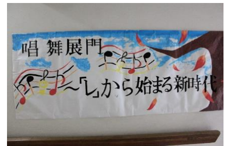
唱舞展門 から始まる新時代