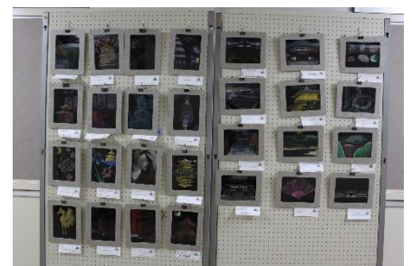
<3年美術：スクラッチ>