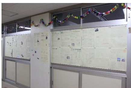
<2年生：職場体験新聞>