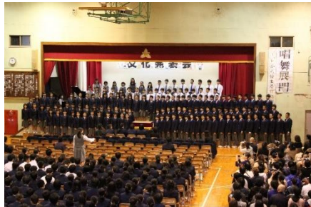
<1年生全体合唱> 課題曲「夢の世界を」