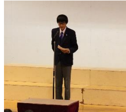
<実行委員長の言葉>