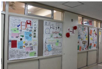
<1年生：都内めぐり新聞>