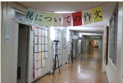
<3年社会：税についての作文>