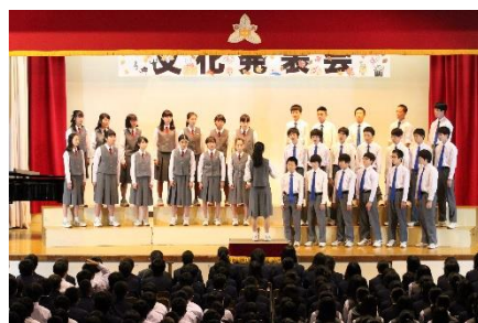
<2年A組> 自由曲「心の瞳」