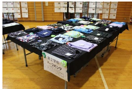
<2年家庭：ハーフパンツ>