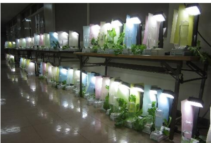
<2年技術：デスクプラントライト>