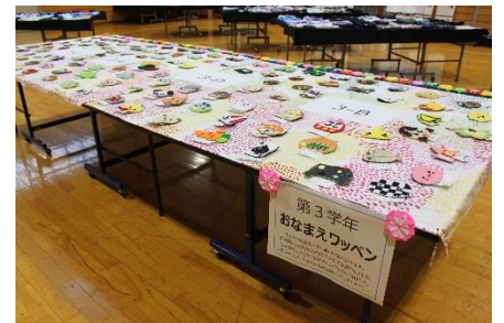
<3年家庭：お名前ワッペン>