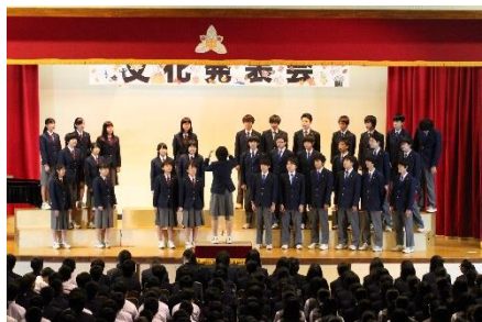
<2年D組> 自由曲「あなたへ」