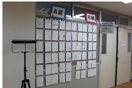
<1年歴史：年代をコロあわせて覚えよう>