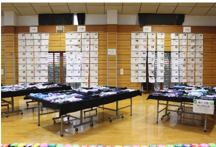
<1年家庭：朝ごはんコンクール>