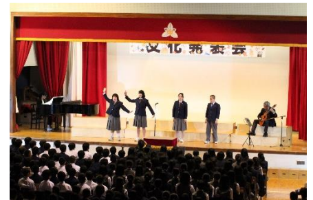
<F組> 「やさしさに 包まれたなら」