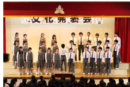
<2年E組> 自由曲「あしたへ」