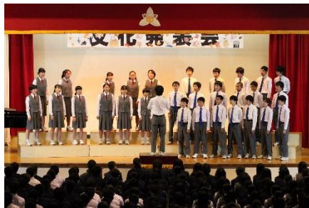
<2年B組> 自由曲「時を越えて」