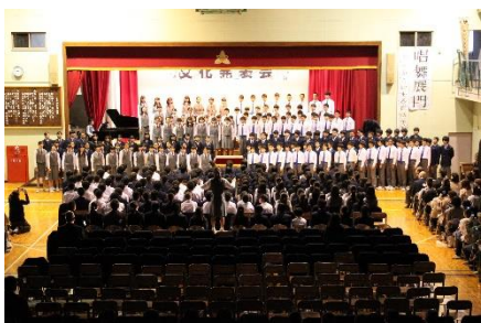
<2年生全体合唱> 課題曲「時の旅人」