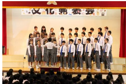
<1年C組> 自由曲「Let's Search For Tomorrow」