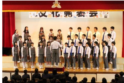
<1年B組> 自由曲「大切なもの」