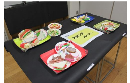
<F組：スポンジペーパー>