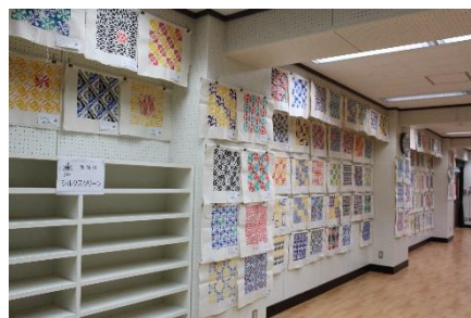
<3年美術：シルクスクリーン>