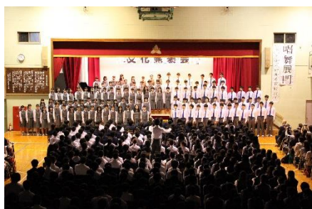
<3年生全体合唱> 課題曲「大地讃頌」