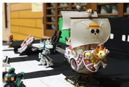
<クラフト・パソコン部>