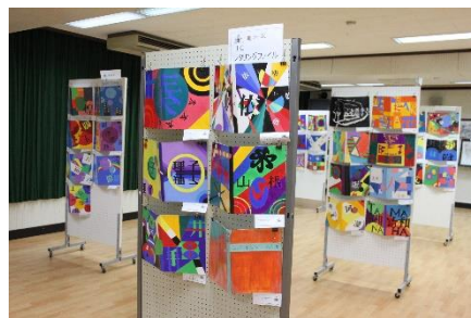
<1年美術：レタリングファイル>