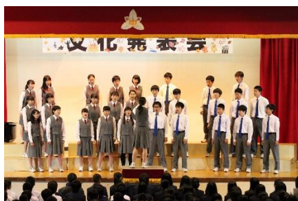
<3年A組> 自由曲「言葉にすれば」