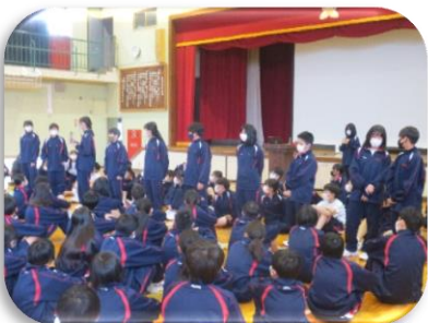
学年集会（専門委員紹介）