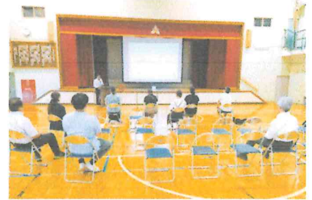
保護者同士の情報交換も出来ました

2部では質疑応答時間があり、日ごろ悩ましい子供のインターネット利用時間の管理について質問がありました。親子でのルールの決め方や時間制限アプリの利用について学び、大変参考になりました。