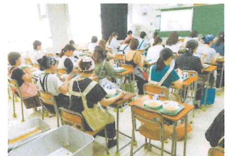
▲感染症対策のため前を向いて試食しました。