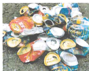
▲ペしゃんこにつぶして…