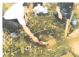
▲種蒔き作業(昨年度)