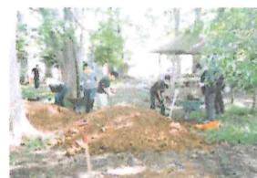
▲父親の会による土質改良作業(昨年度)