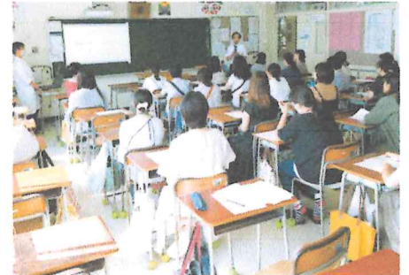
▲栄養士さんの説明を聞きました。

給食だよりに詳しく載っている栄養管理はもちろん、地場産物の使用など食材のこだわり、薄味でも美味しく食べられる調理方法の工夫など、参考になる話ばかりでした。中でも衛生管理は大変厳しく行われており、毎日気を使って調理されているのが伝わりました。