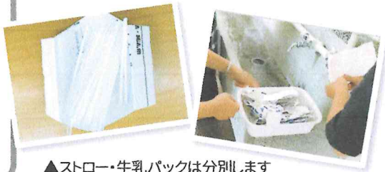
▲ストロー・牛乳パックは分別します