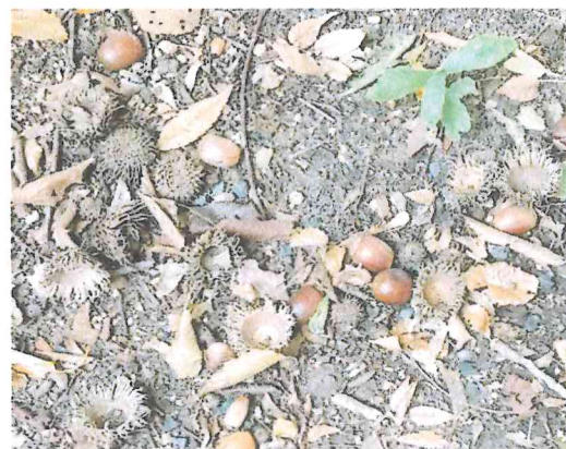
谷原の森のクヌギが今年もたくさん実をつけました。実も帽子もとても立派!

※PTA だよりを谷原中学校 HP ( https://www.nerima-tky.ed.jp/yawara-j/ ) でもダウンロードしてご覧になれるよう調整中ですが、遅れており申し訳ございません。近日中に公開いたしますので、その際には「PTA・父親の会」タブからご確認ください。掲載の写真がカラーで詳細にご覧いただけます。