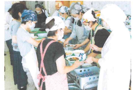
▲子供たちと同じように配膳体験をしました。