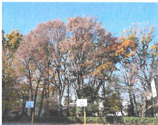
野鳥の休息地でもあります。