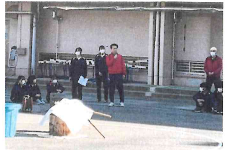
開会式の様子です。