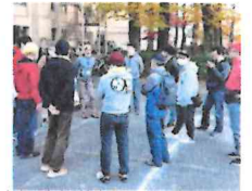
当日ミーティングです。