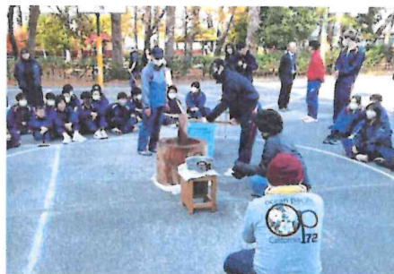
楽しく餅つき体験できましたか？