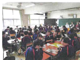
教室でみんなで食べました。