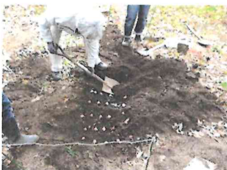
チューリップとフリージアの球根を植えました。