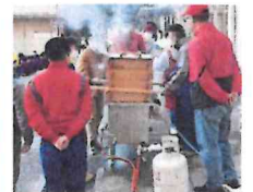
蒸し器で蒸します。