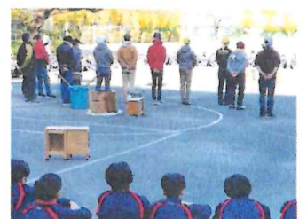
生徒たちから感謝の言葉をもらいました。