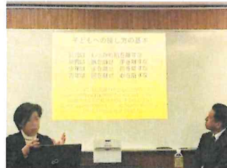
校外生活 【12月9日】アルミ缶リサイクル・清掃活動