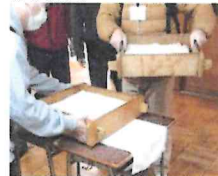
セイロにもち米を入れます。