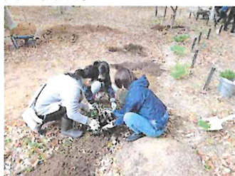
アジサイを植えているところです。