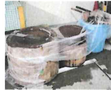
前日から臼に水を張っておきます。