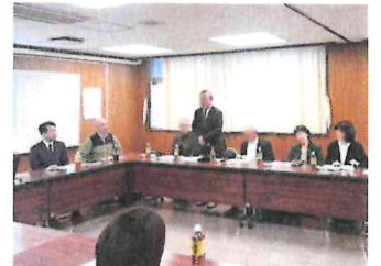
校外生活 【12月21日】標準服リサイクル交換会