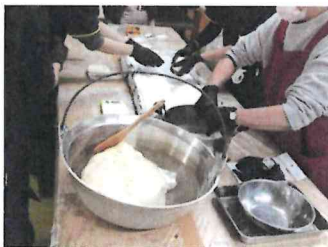
ついた餅は熱いうちにバック詰めしました。