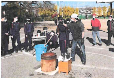
丁寧に教えていただきました。