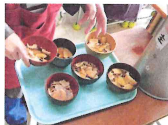
生徒たちには懐中汁粉です。