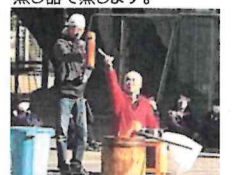
つき方の説明と注意点を指南してもらいました。