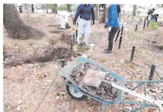
主事さん特製の腐葉土を混ぜ入れました。