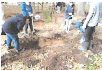
固くなっている土を柔らかく耕しました。

お手伝いのご案内をしていた 11 月 11 日(土)は、土壌コンディション不良のため全体の活動は中止とし、主事さん方に助力いただきながら PTA 役員によりアジサイと球根の植え付けをしました。