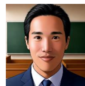
(文責：3学年主任 国語科 永井秀一)

卒業まで残りわずかとなりましたが、最後の一日まで、生徒一人ひとりが自分の進路に向かって自信をもって歩めるよう、学年教員一同、全力で支えてまいります。